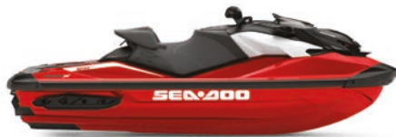
● NEU Fiery Red Premium